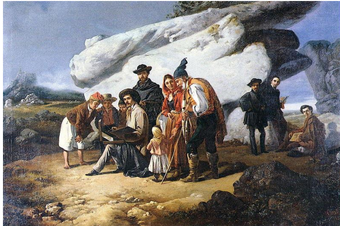
“Cinco Artistas em Sintra” com o Palácio da Pena em fundo (Lisboa, Museu de Arte Contemporânea - Chiado) 1855