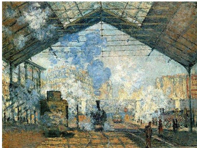
“Gare Saint-Lazare” (Paris, Museu de Orsay, França)