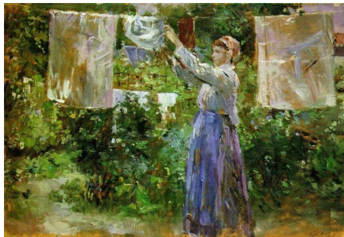
“Camponesa pendurando a roupa lavada” (Copenhaga, Ny Carlsberg Glyptotek, Dinamarca)